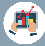
Reportes en tiempo real